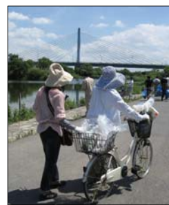
サドルの取れた自転車を回収