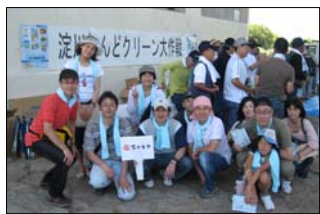
清掃後、参加者全員